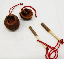
キーホルダーをいただきました。