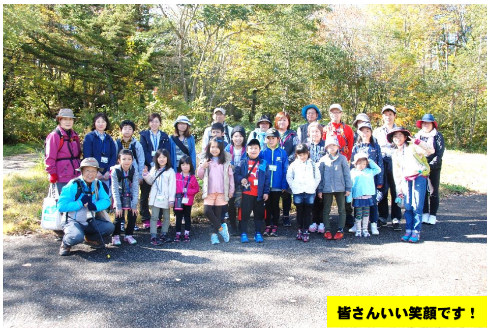
皆さんいい笑顔です！