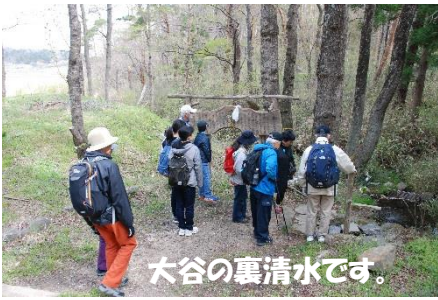
大谷の裏清水です。