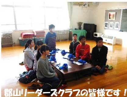
郡山リーダーズクラブの皆様です！