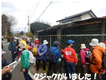
クジャクがいました！