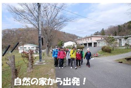
自然の家から出発！