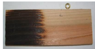
<杉板をバーナーで焼く>